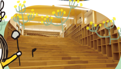
お気に入りの絵本に会ってね