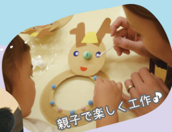
親子で楽しく工作♪